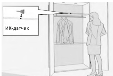
Вариант установки SR2-Door